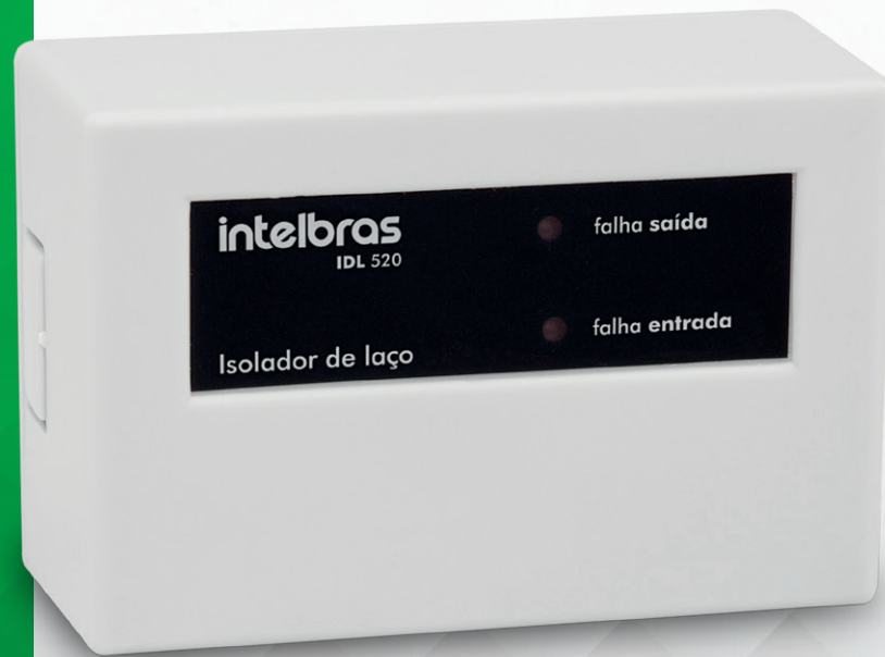
Isolador de laço