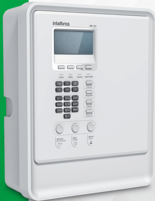
Central de alarme de incêndio